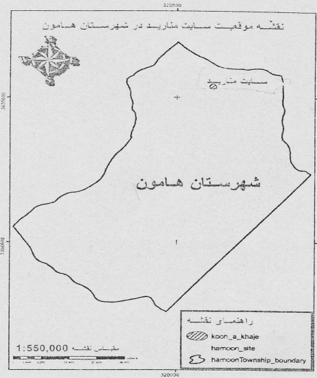
موقعیت سایت منارید در شهرستان هامون